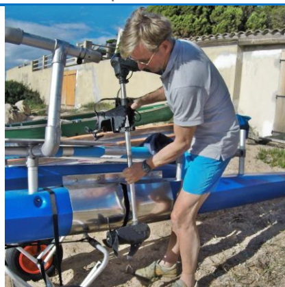
Mise en place du moteur